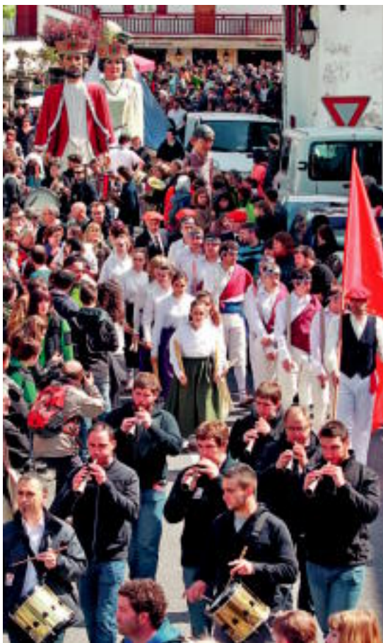
Kalean izango da festa Nafarroaren Egunean. BOB EDME/LE JOURNAL

Historikoak eta kulturak batzen dituen herri bat irudikatzen da urtero-urtero Baigorri egiten den Nafarroaren Egunean. 36. aldia izango du aurtengo egunak, eta egun osoko festa antolatu dute.