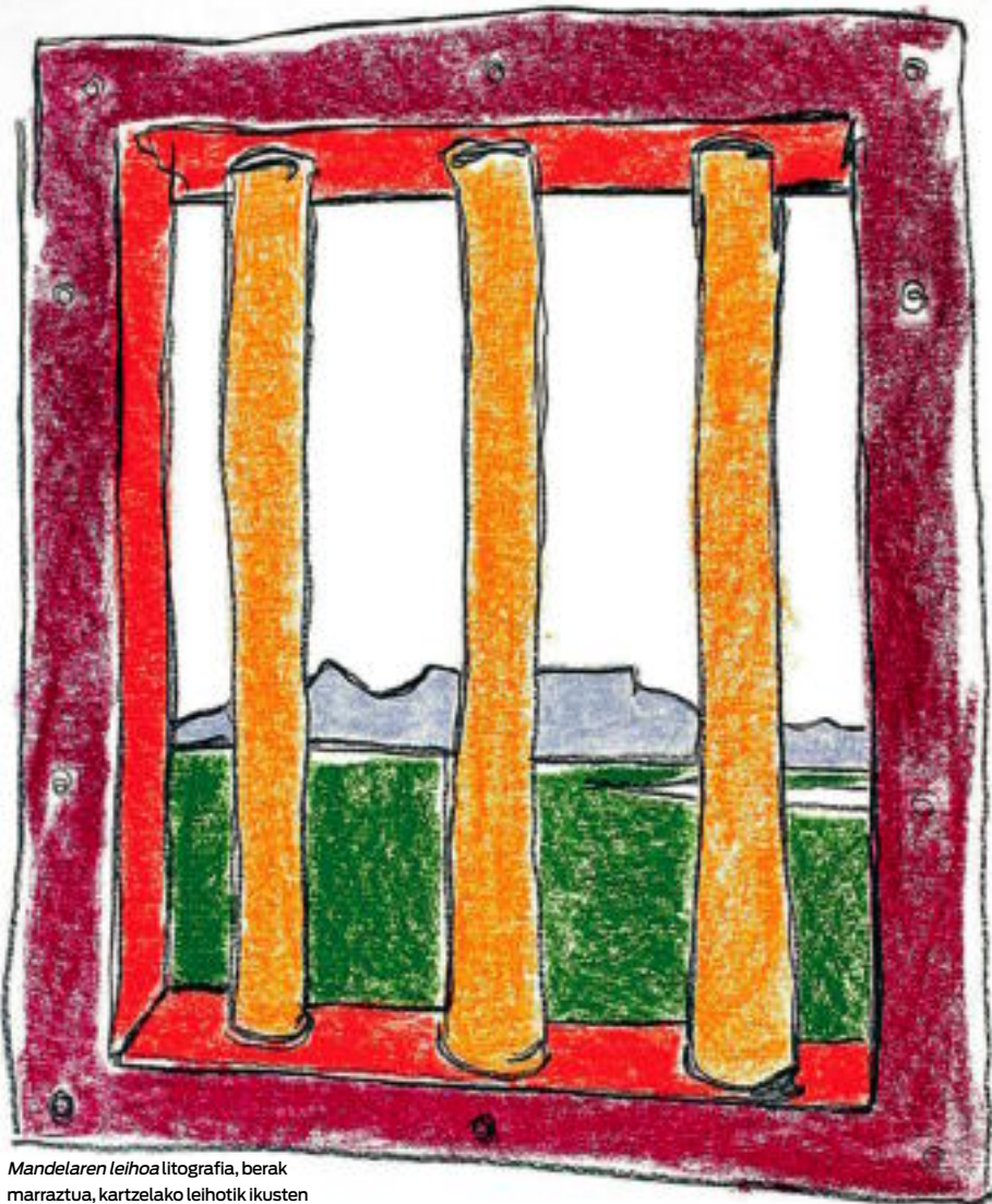
Mandelaren leihoa litografia, berak marraztua, kartzelako leihoitik ikusten zuena irudikatuz. NICK BOTHMA / EFE