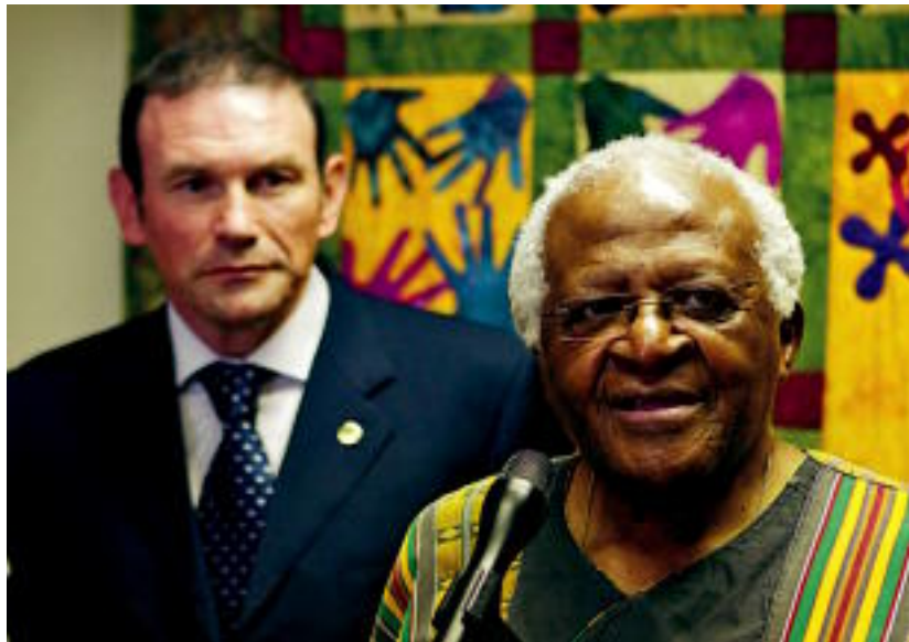
Juan Jose Ibarretxe lehendakari ohia eta Desmond Tutu artzapezpikua, 2008an, Lurmutur Hirian.