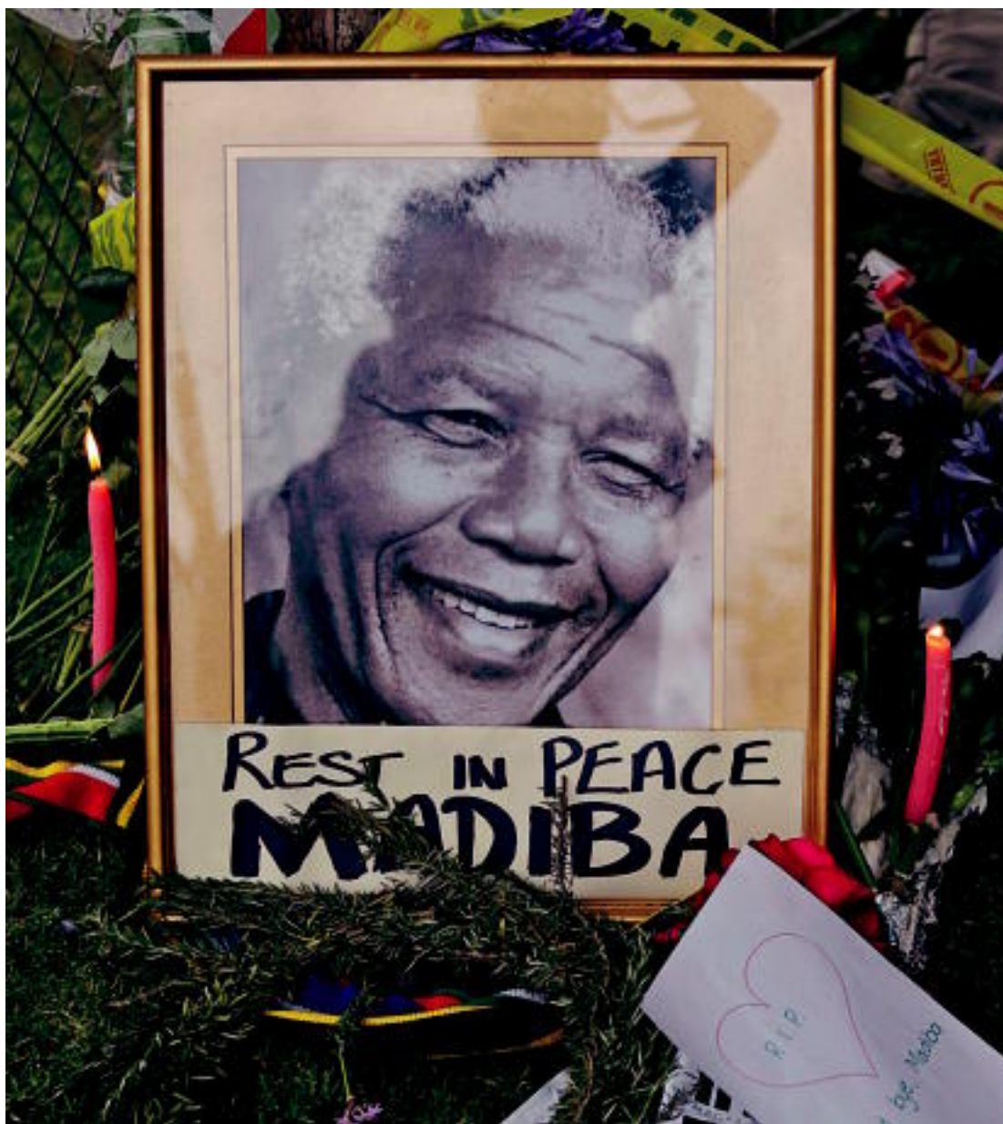
Mandelaren omenez paratutako irudia, haren etxe parean, Houghtonen, Johannesburgoko kanpoaldean, atzo.

Mandelaren heriotzak, Hegoafrikan ez ezik, atzerrian ere egundoko oihartzuna izan du, jada hil aitzinetik mitoa zen seinale. Hileta egin gabe, galderak hasiak dira zer izanen den Madibarik gabeko Hegoafrikaz.