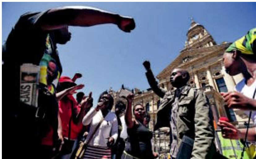
Lurmutur Hiriko udaletxe pareta, atzo. Hor eman zuen Mandelak lehen hitzaldia aske gelditu ondoren.

galdu du, umiltasunaren, justiziaren, bakearen eta milioika lagunen itxaropenaren pertsonifikazio bat, hemen eta atzerrian». Oposizioko alderdiengan, gazte erakundeetan eta sindikatuetan aho batekoak izan dira Mandelaren aldeko hitzak.