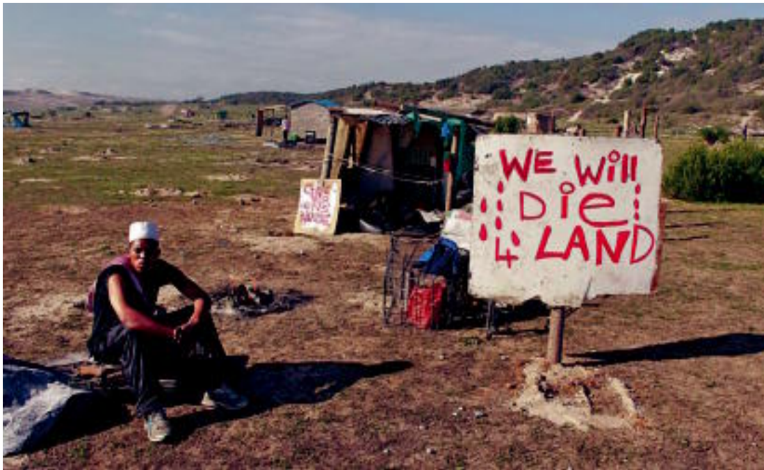
Gizon bat protestan, Lurmutur Hiriko etxola auzo baten hustearen aurka, 2011n.