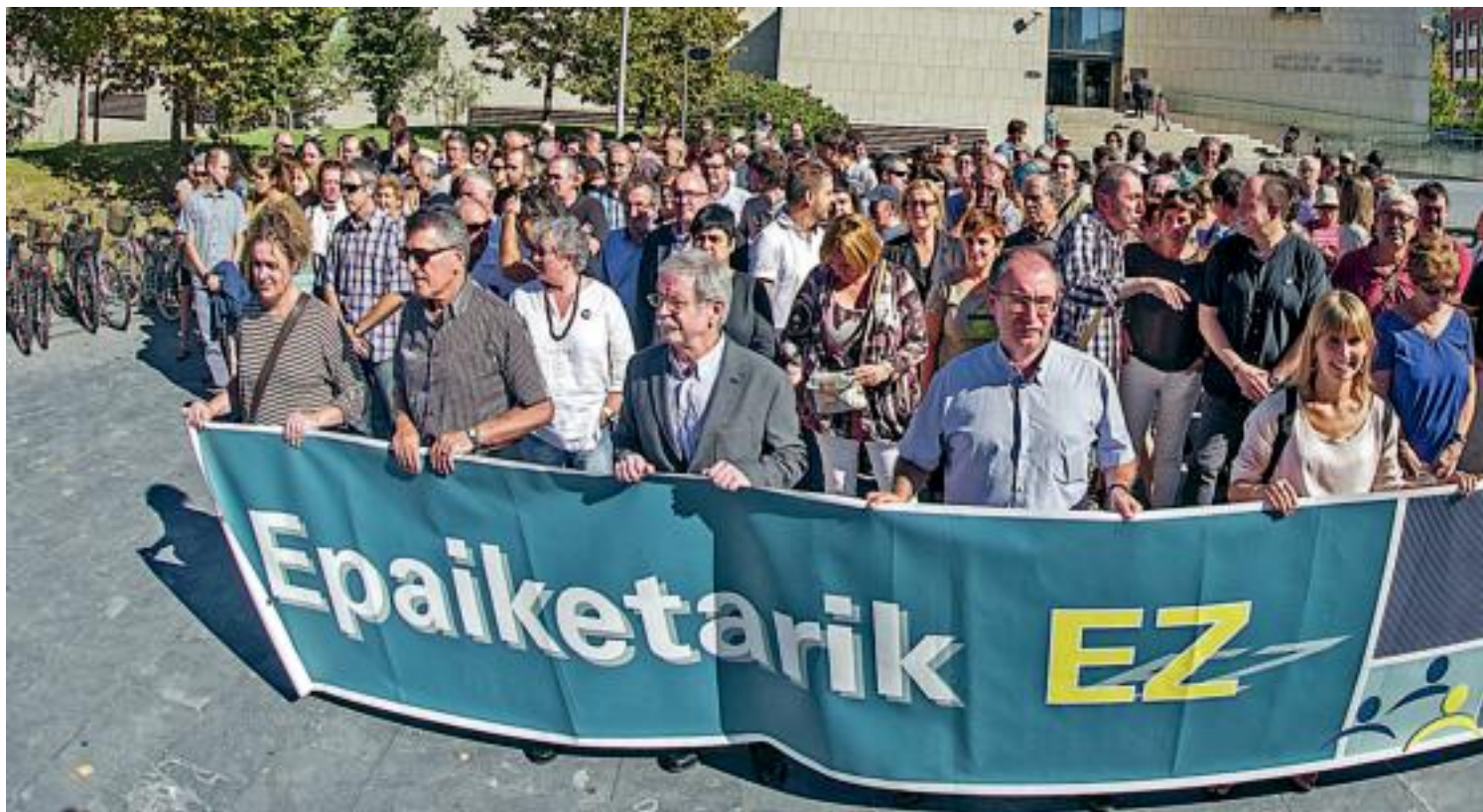
Egunkaria-ren alde elkarrekin auzi ekonomikoaren itxiera eskatzeko joan den irailaren 18an Donostian egindako elkarretaratzeari. Parkartarekin, auzi ekonomikoko sei auzipetu.