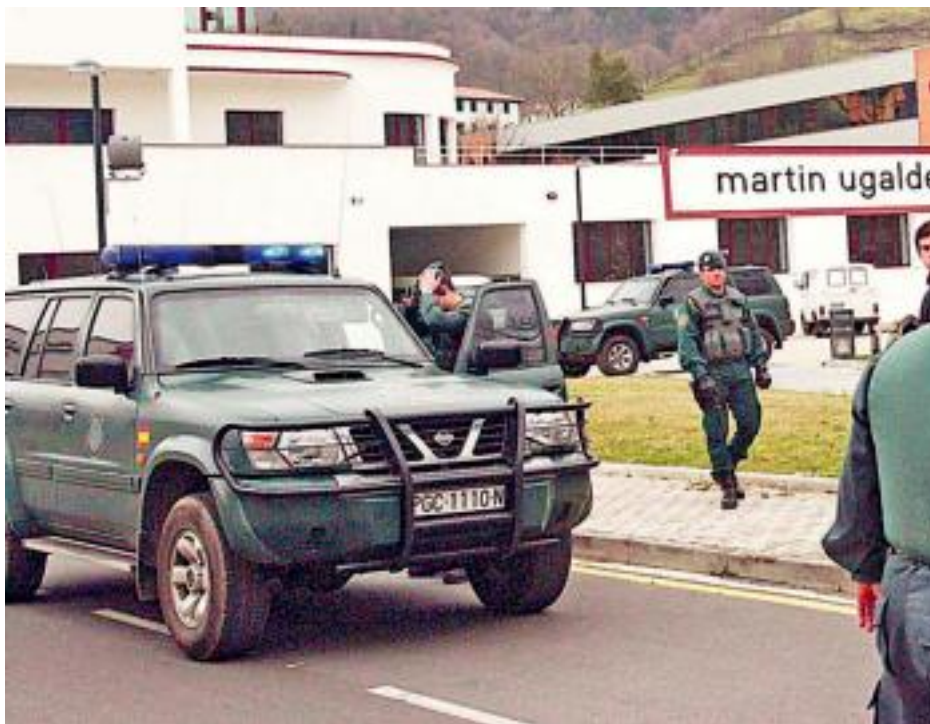
Guardia Zibila, Andoingo Martin Ugalde kultur parkean, 2003ko otsailaren 20an.

Azaroak 18. Egunkaria auzia itxeko eskatu zuten Eusko Lege-