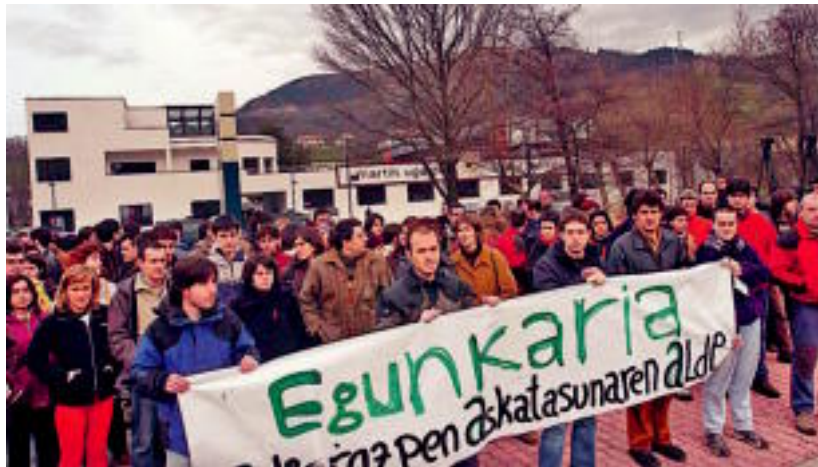
Euskaldunon Egunkaria -ko langileak, kazeta itxi zuten egunean, kanpoaldean.

@ 'Egunkaria auziko' informazio gehiago nahi izanez gero, bisitatu webgune hau: berria.eus/egunkaria/