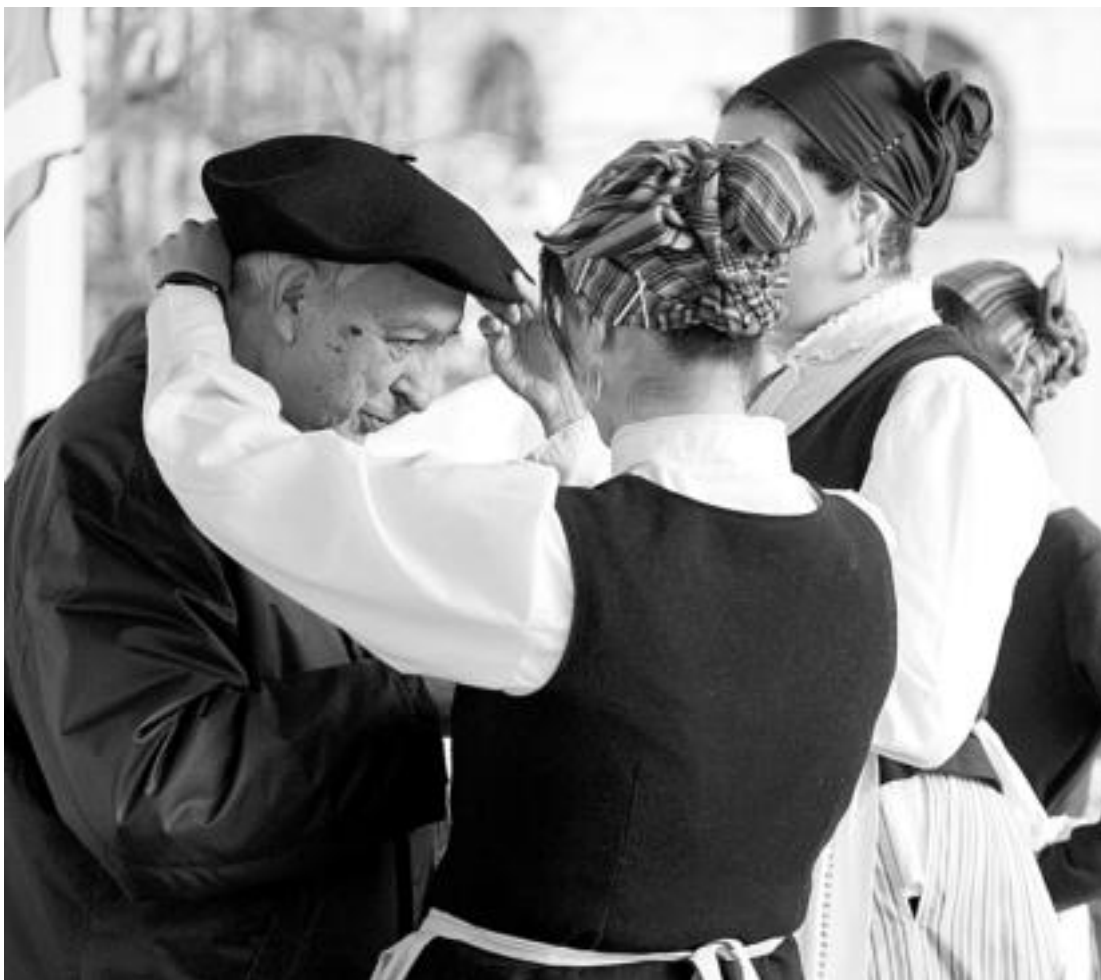
Txillardegik, iaz, Donostian EHEk antolatuta egin zioten omenaldian.

Euskara batuaren aitzindari eta hizkuntzalari nekazina izateaz gain, herriari euskararen garrantziaren kontzientzia politikoa hartzen lagundu zion Txillardegik, bizitza osoko lan oparo eta etengabea.