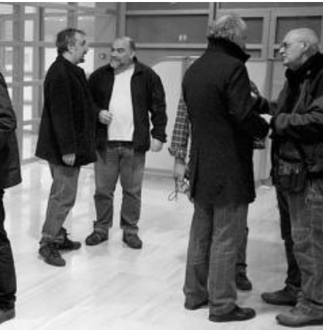
dezkariekin, belatokia.