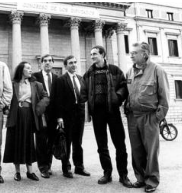
Espainiako Gorteetako jauregiaren atarian, 1989an. BERRIA