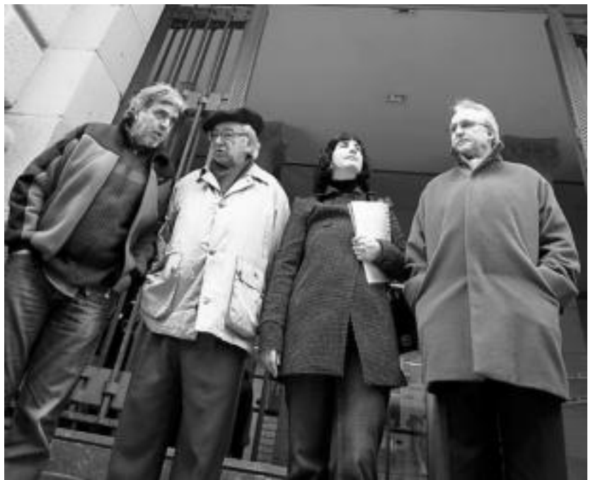
EAE-ANVrekin 2008an Espainiako Gorteetarako bozetan hautagai aurkeztu zenean.