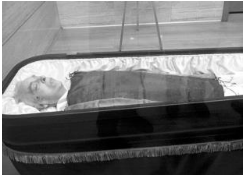
Jose Luis Alvarez Enparantza Txillardegiren hilotza, atzo arratsaldean, Errekaldeko bellatokia, Donostian. Txomin ETAKo buruzagi historikoa estali zuen oihal berberak estali du Txillardegiren gorpua ere.

1976an unibertitatean hasi zen lanean, hizkuntzalaritzan espezialista gisa. Bordeleko Unibertsitatean, EUTGn eta Deustuko Unibertsitatean irakasle izan zen, 1967tik 1983ra arte. 1983-84ko ikasturteak aurrera, Zorroagako Fakultatean soziolinguistikako irakasle izan zen. 70 urte bete zituen, katedratiko emeritu izendatu zuen EHUK. Euskal Herrian Euskaraz taldearen sortzaileeta-