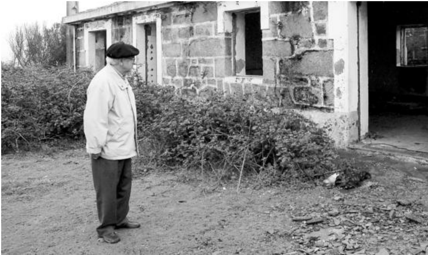
Txillardegia, Ferrolgo mendiguru batean, Leturiaren egunkari ezkutua idatzi zuen lekua bisitatzen, 50 urte geroago, 2006an; Espainiako armadak airekoen aurkako bateria bat zeukan leku hartan. PACO VILA