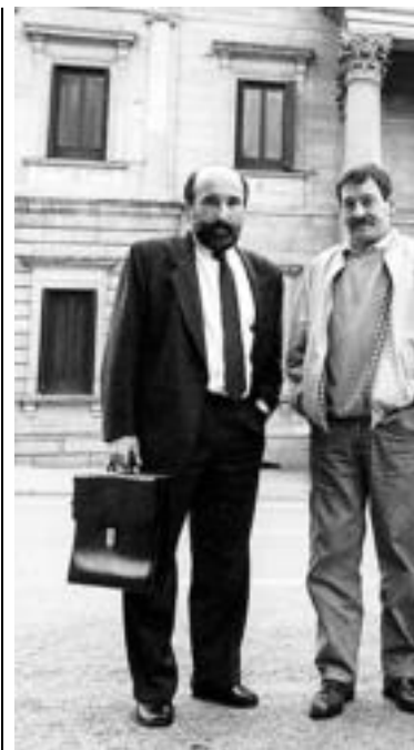
Herri Batasuneko diputatu eta senatariekin

Ekin eta ETaren sortzaileetako bat izan zen Txillardegi. Bilbora joan zenean Ingeniaritza ikastera, ikaskide batzuekin ba-