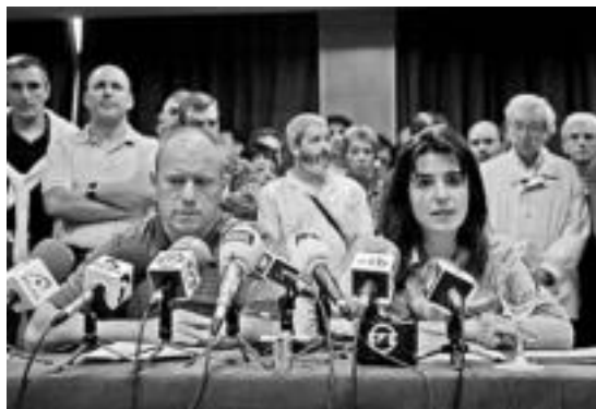
Aralarrek egindako prentsaurreko jendetsu batean, 2005ean.