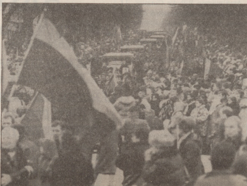
Miloi erdi lagun bildu ziren Lituaniar 13ko hildakoen hiletetan.

Giulianik esan zuenaren arabera, NBEren Segurtasun Kontseiluak edo Asambladaren baimena duenean soilik, ihardun dezake Javier Perez de Cuellar NBEko idazkari nagusiak estatuen barneko arazoetan.