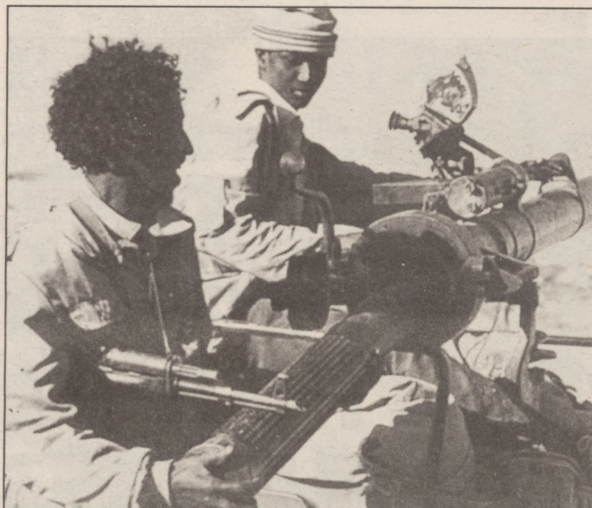
Hawiye klaneko gerrilariak borrokan. Siad Barre lehendakaria Marehan klanekoa da.

HIRU KLAN ELKARTUTA Borroka ideologikoa baino, tribala da Somaliako gerrakoa. Etnikoki, herrialde homogeneoa dela dirudi, % 98,8 somaliarrak dira, somaliera mintzatzen dute eta musulmanak dira. Baina, klan edo tri-