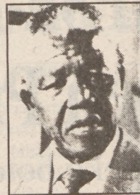
NELSON MANDELA ANCko buruzagia EL PAIS 1991-VI-25

«Santioekin jarraitu beharra dago 'apartheid-a' amaitu arte»