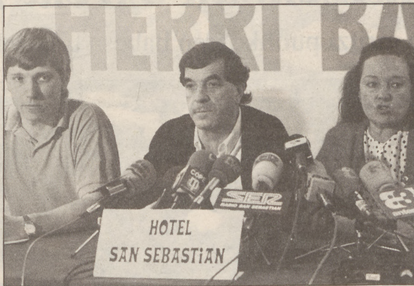
HBko kideek eman zuten atzo proposamenaren berri.