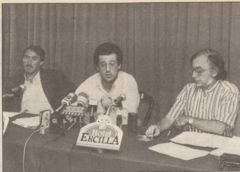
Unibertsitateko irakasle, abokatu eta kazetariak osatutako taldea da. J.SIMAL