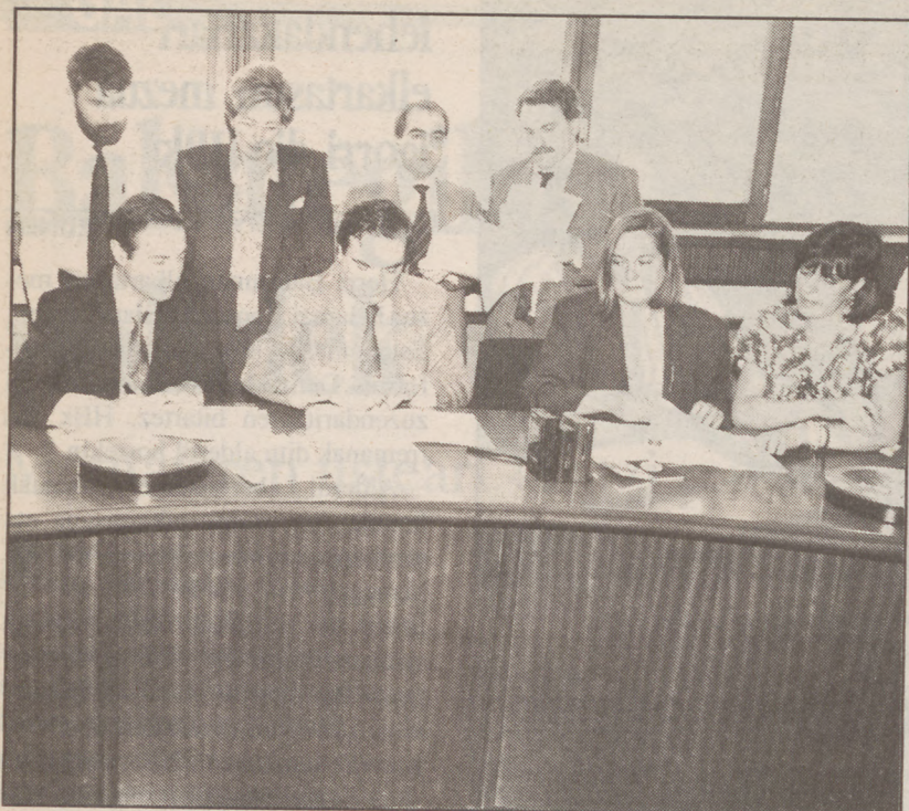
EHUko irakasleen komenioa atzo sinatu zuten