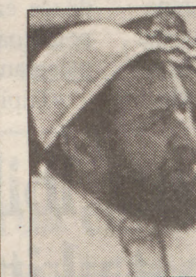
ABASSI MADANI Aljeriako buruzagi integrista EL SOL 1991-VI-29

« Indar batzuk lanean ari dira Jugoslavia suntsitzeko. Hain zuzen ere, indar populista, ultranazionalista eta neofaxistak »