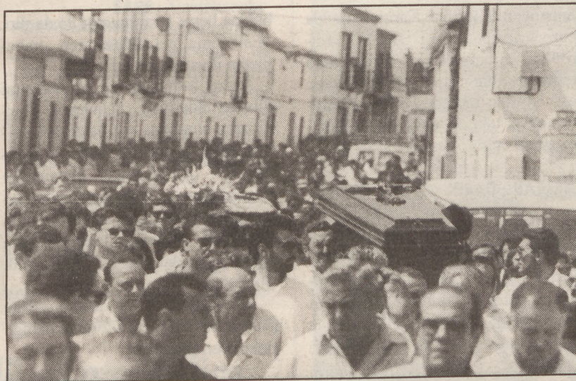
Sevilla-1 gartzelako atentatua hil zen funtzionaria atzo lurperatu zuten.

Gartzelako UGT, CCOO, CSIF eta ELA sindikatuek bost minutuko geldiduna egitera deitu zuten atzo eguerdirako eta USO eta ACAIT sindikatuek ere bat egin zuten deialdiarekin.