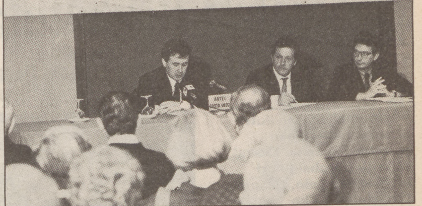
Udal programa aurkeztu eta paktuak aztertu zituen Donostiako EAK. C.VILLAGRAN

Gure lana, gure Herriaren alde E4 Trabajam por nuest Pueblo eusko alkartasuna