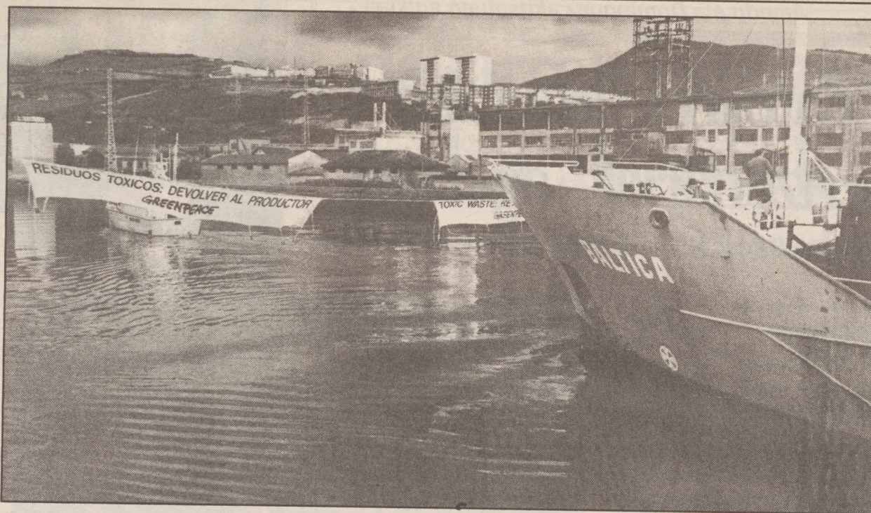
Greenpeacearen protesta ekintza eragotzi zuen Armadaren untiak.