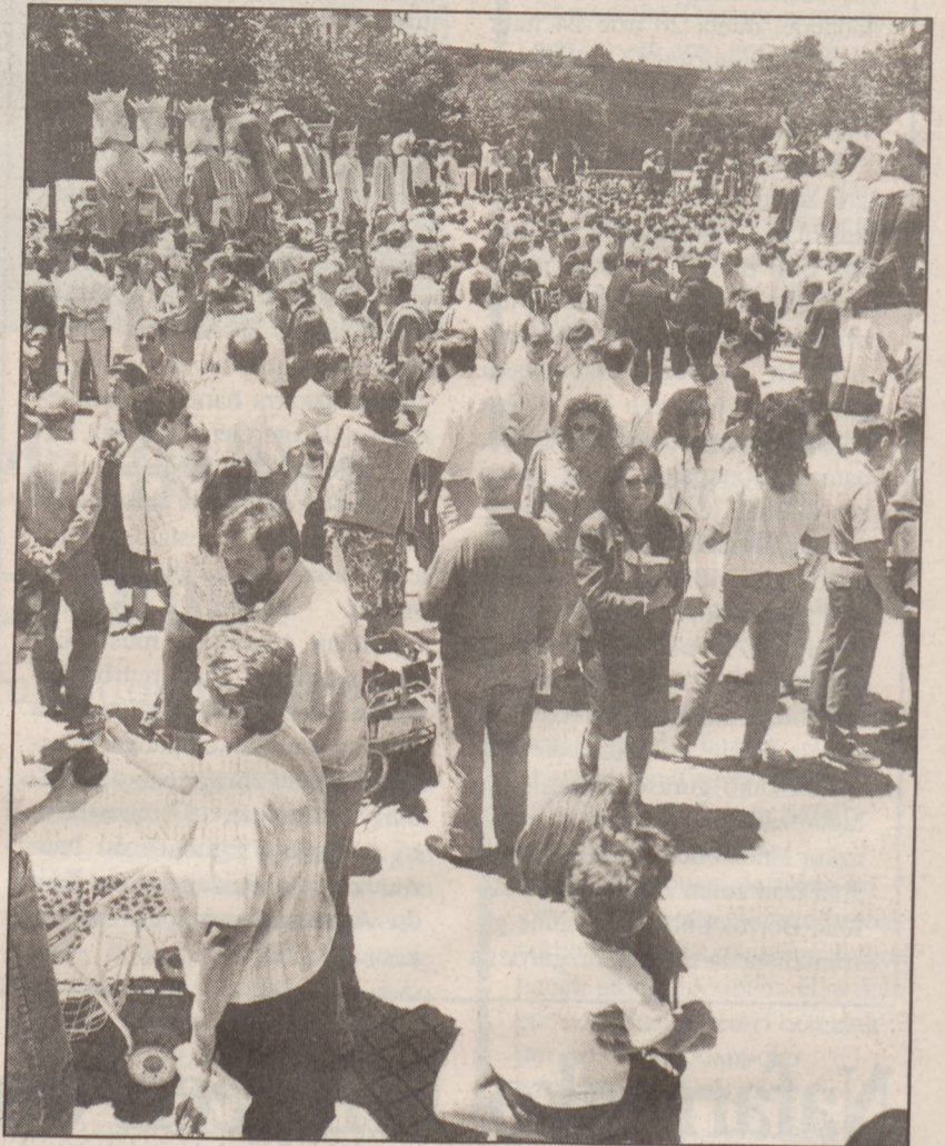
Jai giroa pil-pilean dago Iruñean.

Eta atzoko egunean giganteak protagonistak izan baziren ere, ezin ahaztu udaletxeak berak sortu zuen ikusmina. Izan ere, Nafarroako Museoak erakusketa bakar batean ere ez bait du oraingoz bildu atzo etxe ho-