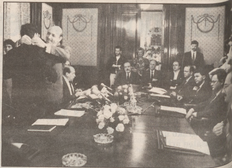
Kargu hartzearen ondoren lehenengo bilera egin zuten diputatuek.