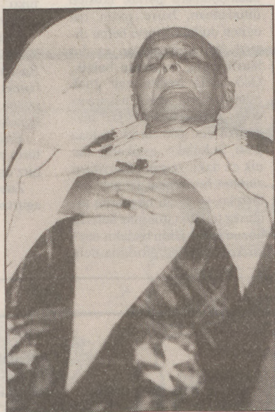
Gaur egingo dira hileta elizkizunak.