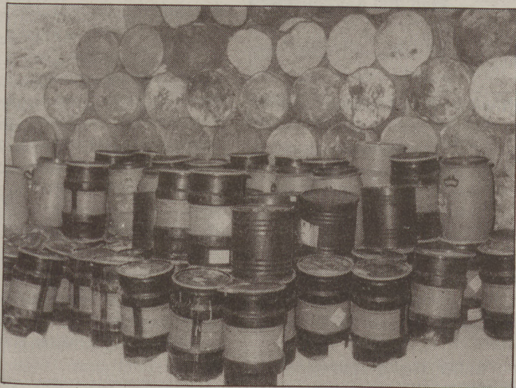
Erregaiek hondakin arriskutsuak sortzen dituzte.

Aipaturiko gai honetaz gain, azufredun gasoilaz proposamenaz ere hitzegin zuten atzo Belgikako hiriburuan. Honi buruzko normak 1994eko urtarrilean jarriko lirake indarrean. Arauok diesel bezalako beste erregai batzuen arlora hedatuko lirake, 1996. urtetik aurrera. Guzti hau onartu ahal izateko egungo birfindegiak birmoldatu beharra dago zenbait estatuk eskatu duten bezala. Titanio dioxinotik eratorriak diren hondakinen poluzioa murrizteko moduak ere aipatu zituzten atzo Europako Komunitateko Ingurugiro ministroek. Carlos Ripa di Meana Ingurugiro komisariak agiri bat aurkeztu zuen Brusselen ozono geruzari kalte egiten dioten gas klorofluorokarbonatuak murrizteko proposamena zabaltzeko. Ripak gas hauek desagertarazteko epea askoz ere lehenago ezartzea nahi du.