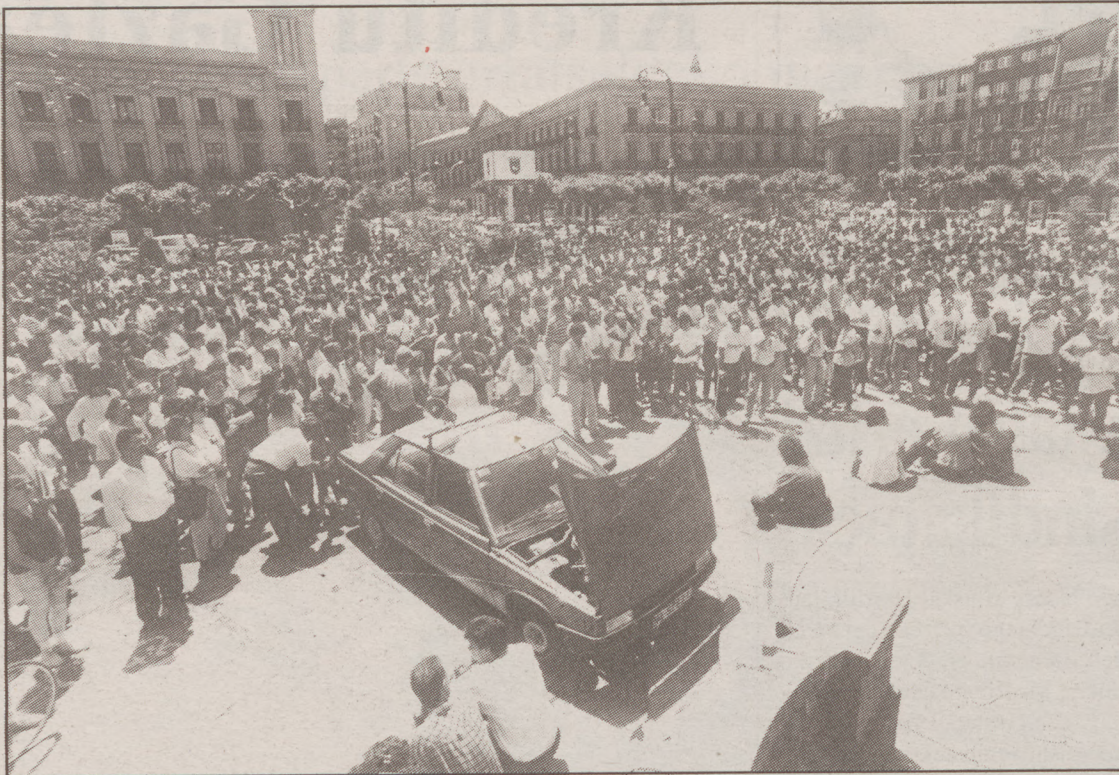
Langileen kontzentrazioa Gaztelu Enparantzan.

Aipatzekoak dira egun osoan Polizia eta piketen artean gertatutako istiluak, batez ere goizean. Iruñean 16 urteko gazte bat atxilotu zuten merkataria bat denda ixtera behartzeagatik, Poliziako iturriek azaldu zuten. Alde Zaharrean karga polizialak egon zirela salatu zuten sindikatu abertzaleek, «Poliziaren presentzia txundigarria izan da, Alde Zaharrean kartelak kendu dituzte