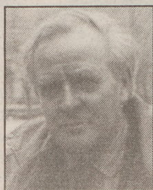
John Le Carré