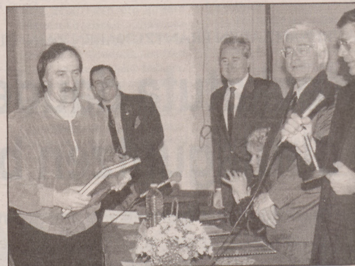
Maulen omenaldia egin ziotenean, prefetaren eskutik makila jasotzen.