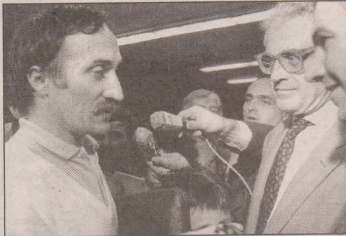
Seasko lehendakari zela Lionil Jospin orduko Hezkuntza ministroarekin egindako bilkura batean.