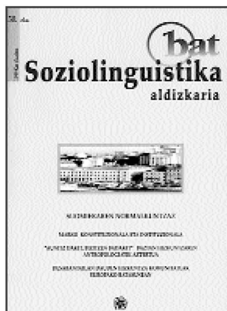
Bat aldizkariaren ale berria.

Halaber, aipamen egin die suomieradunek hitz berriak sortzeko erabili dituzten moduei ere. Halakoetan suediar hizkuntzaren gerizpetik at jarduten jakin dutela dio Txillardegik.