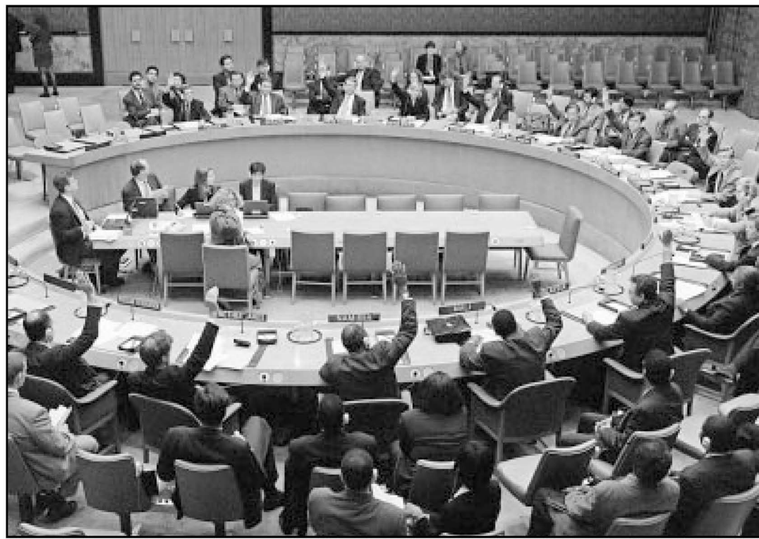
Segurtasun Kontseiluko kideak, arma bahimenduaren aldeko botoa ematen.