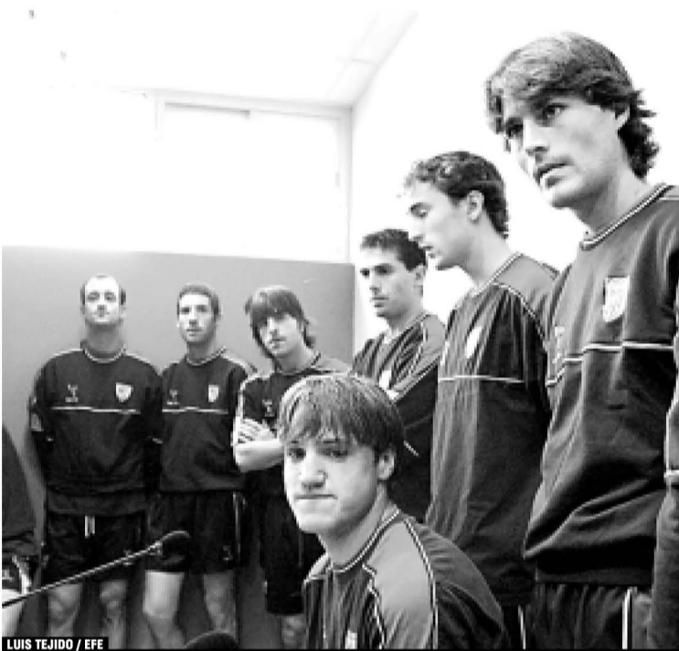
LUIS TEJIDO / EFE

Gurpegik errugabea dela adierazi du, taldeko zuzendarien, teknikarien, medikuen eta jokalariren babesean