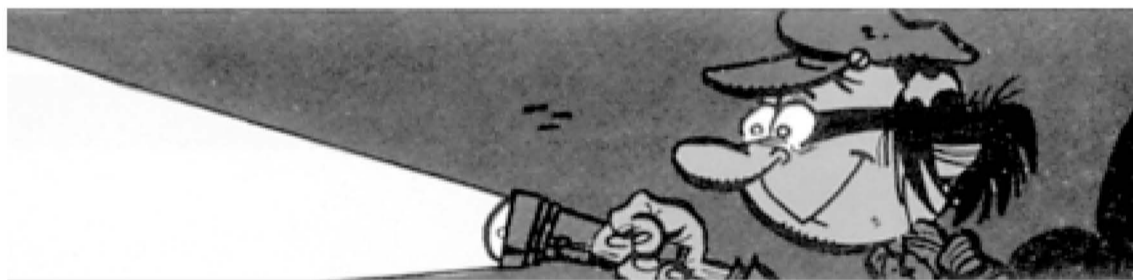
Kipe da Ipurbeltz -ek ezagutzera eman dituen personaietako bat. Behean, beste bat ageri da: Punki.