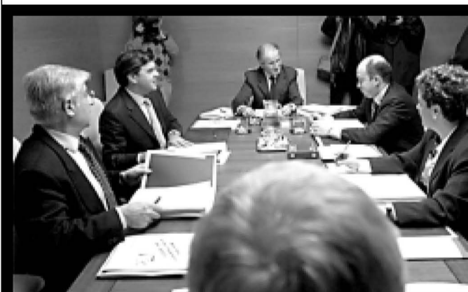
Eusko Legebiltzarreko Mahaiaren atzoko bilera.

Igande honetan zortzi abiatuko da Korrika Kulturala, Donostiako Kursoalen izango den Hamalau baietz 1965-1975 ikuskizunarekin —hasiera batean behin bakarrik taularatzeko asmoz egina—. Arduradunek ekitaldi ugari antolatu dituzte aurten ere, Korrika 13ren aurreko asteetarako; hitzaldiak, musika jaialdiak, dantza ikuskizunak, antzerkia, zinema, bertso eta pilota jaialdiak... Euskal Herriko leku anitzetara iritsiko dira ekitaldiak; izan ere, Korrika Kulturala herrialde guztietara iristen den ekimen bakane-takoa baita.