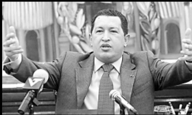
Hugo Chavez, Venezuelako lehendakaria.