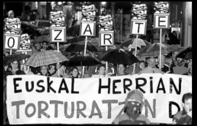
Tortura salatzen duen manifestazioa Durangon, iazko abenduan.

Eusko Jaurlaritzako Herraingoa Sailak atxilotuekiko bi neurri abiatu ditu, tratu txarren salaketak faltsuak direla erakutsi nahian: senideekin harremanetan jartzea eta inkomunikazioa ezarri aurretik osasun azterketa bat ahalbidetzea. Abiapuntu bat bada ere, tratu txar fisiko eta siki-koen itzala ezabatzeko, ordea, beste zenbait neurri ere beharrezkoak dira. Funtsezkoena inkomunikazioa ez erabiltzea eta atxilotuari komisarian konfiantzako abokatuarekin deklaratzeko eskubidea aitortzea da. Halaber, gogoratu behar da egungo auzitegiak ez direla tortura zigortua izango den bermea, eta tratu txarren hainbat salaketa sinesgarriak izan direla nazioarteko adituentzat.