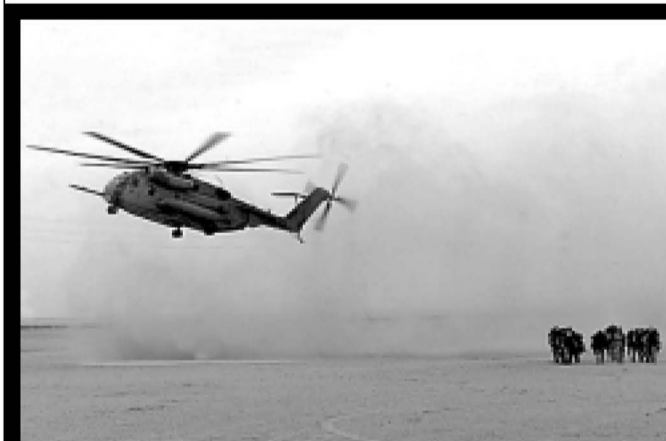
AEBetako soldaduen entrenamenduak Kuwaiten.

UPNk eta PSNk aurkeztu diete gainontzeko alderdiei Nafarroako Unibertsitate Publikoko Euskararen Legearen zirriborroa. Eta horixe izango da, funtsean, azkenean legearen beraren edukia. Bi alderdiek bat egin dute NUPen euskara gero eta gehiago murrizteko eta euskaldunei NUPen eskubideak ukatzeko. Euskarak gaur egun duen leku eskasa baino eskasagoa izango baitu aurrerantzean: Irakasle eta Filologia ikasketak eta hautapen libreko zenbait ikasgai. Horrez gain, NUPen estatutuak berritzeko prozesuan daude, eta bai NUPeko Euskararen Legea eta NUPeko estatutuak osagarriak dira. Alegia, euskara eta euskaldunak beti galtzaile.