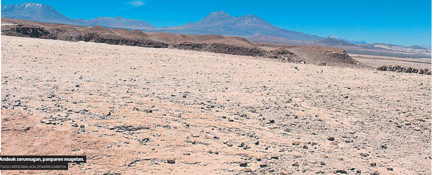
Andeak zerumugan, panparen mugetan. ITSASO ARRIZBALAGA ZENARRUZABETIA