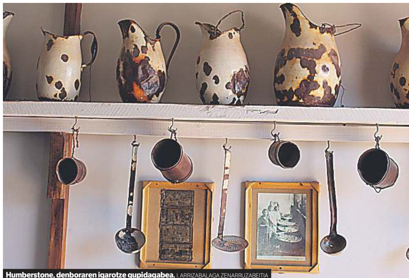
Humberstone, denboraren igarotze gupidagabea. | ARRIZABALAGA ZENARRUZABETIA