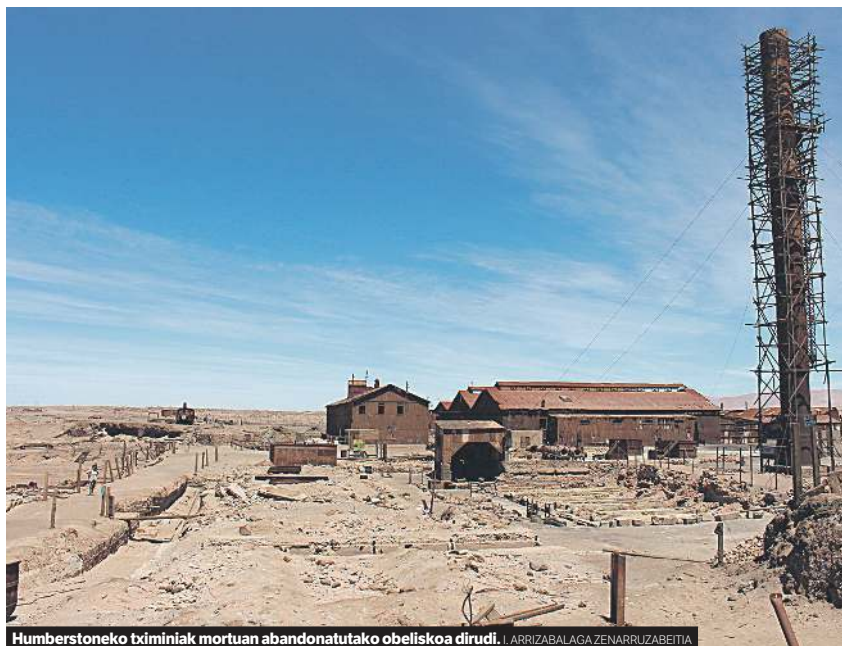
Humberstoneko tximiniak mortuan abandonatutako obeliskoa dirudi.

testigantza isilak. Humberstone izan zen Nitroaren Bulegoen artean handienetakoa, milaka langile eta haien familien lantoki, bizitoki eta borroka leku. Hemen sortu zen Txileko langile mugimendua, hemendik abiatu ziren Santa Maria de Iquiqueko sarraskian akabatuko zituzten langileak. Hemen garatu zituzten britainiar jabeek zigor eta sari teknikak, bitxikeria filantropikoak eta ustiapen mugagabea. Eta hemen gordetzen da, oraindik, urte haie-tako memoria, Humberstone osoa museo bilakatu duen elkarte bati esker. Labe erraldoiak eta obelisko herdoildua dirudien tximinia luzea, umek eskuz egingo jostailu txikiak gurasoen lan tresnen pareko, ugazabaren etxe dotorea eta tenis kantxa langileen etxolen aurrean, lekuz kanpo dauden egurrezko antzokia eta burdinurtuzko igerilekua, aldarrikapenez eta oroimenez betetako kale hutsak.