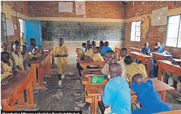
Nembako Mbuga eskolako ikasle talde bat. Lehen hezkuntza doakoa eta derrigorrezkoa da Ruandan. I. DIEZ DE ULTZURRUN SAGALA