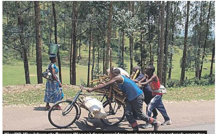
Kigalitik Kivu lakura eta Gomara (Kongo) doan errepidea: emakumeek karga astunak eramaten dituzte buru gainean, eta bizikletak zemahi garraiatzeko ballatzen dira. I. DIEZ DE ULTZURRUN SAGALA

egoskorrek zirela argitu zigan, konpondu arren, eurriak urtero hondatzen dituela, eta istripu larri asko gertatzen direla. Politikaz ez hitz egiteko ere aipatu zigan, bera ez dela politikaz mintzatzen, politikaz gobernuak eta irratietako esatariek baizik ezin dutela hitz egin.