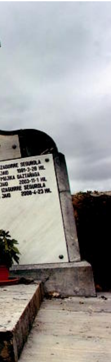
hilobi parean ageri da.

guztieki Madrilen itxitako hilkutxa ezin zela ireki erreplikatzeko. Unzurrunzagak bazekien zergatik. «Presoen abokatua nintzen garai hartan. Lehen eskuko informazioa neukan. Hura hil bezperen Carabanchelgo Ospitalean bertan izan nintzen, eta han esan zidaten Arregi hiltzen ari zirela. Denek ze-