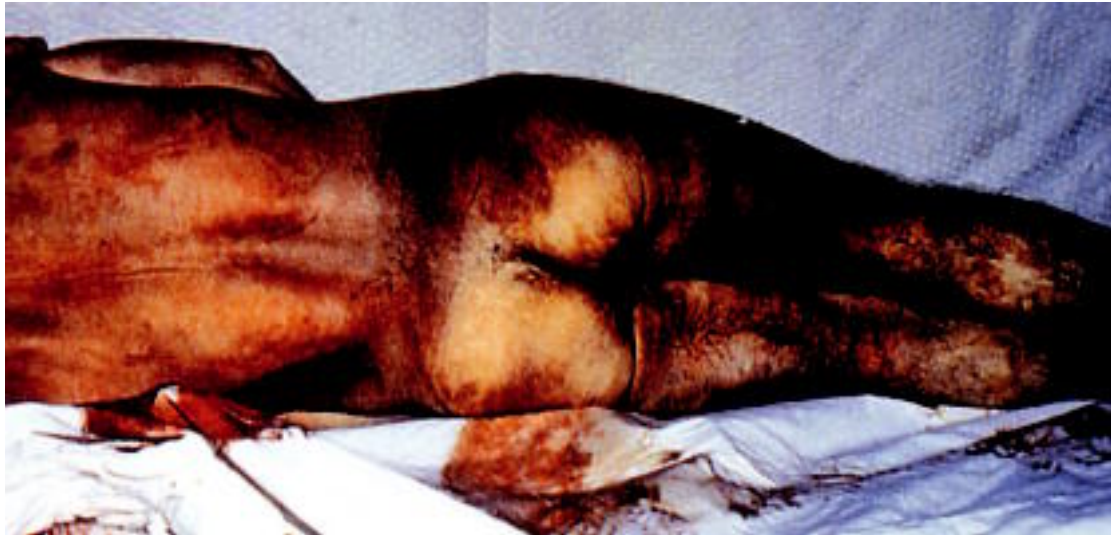
Hemezortzi. Zizurkilgo hilerriko depositoa ateratako hemezortzi argazki jaso zituzten hainbat hedabide eta erakundetan, ahalik eta gehien zabaltzeko eskaerarekin.