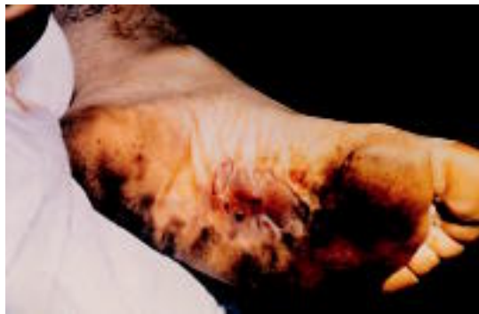
Erredurak. Arregiren oin azpietako erredura beldurgarrien detailea.

di, talde edo koalizioen manipulazio edo erabilpen oro».